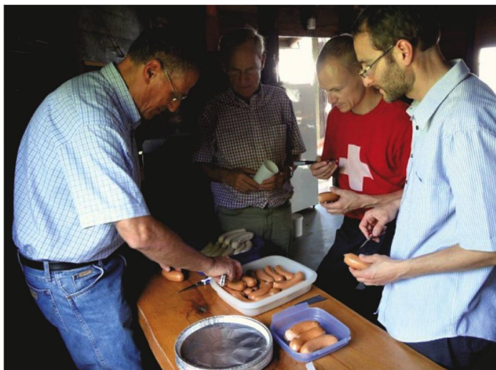
Grillhütte Hattenheim: Fachmännisch werden Cervelats und Bratwürste für den Grill präpariert