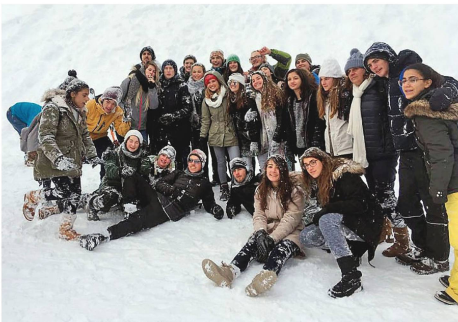
Schülerinnen und Schüler im Schnee: Alpines Vergnügen auf der Grütschalp bei Mürren.

zulernen: Sie fuhren nach Zürich, sahen ein Handballspiel und genossen den Schnee in den Alpen. Bei einem Besuch in Genf hörten sie einen Vortrag über Flüchtlingsrechte in den Büros der UNHCR. Danach besuchten sie das Museum des Internationalen Roten Kreuzes. Besondere Highlights waren die Besuche in einer Käse- und einer Schokoladenfabrik in Gruyère.