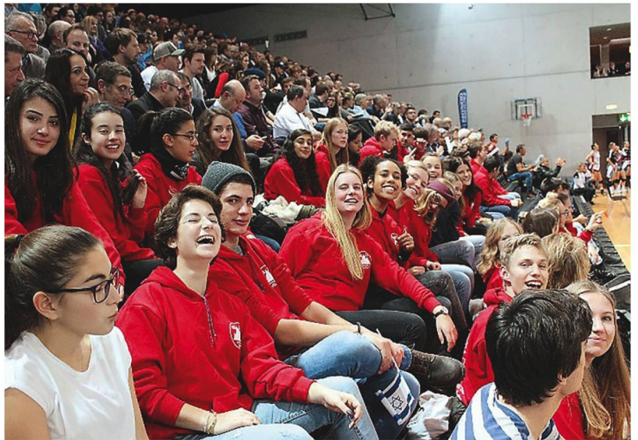
SchülerInnen beim Handball: Schülerinnen und Schüler aus Jerusalem und der Schweiz besuchen ein Handballspiel in Bern.

Ende 2017 besuchten 20 Schüler aus den Jerusalemer Gymnasien Ziv und dem Tali Gymnasium das St. Michel Gymnasium in Fribourg. Sie freuten sich, ihre Schweizer Freunde wiederzusehen, die im August Jerusalem besucht hatten. Die israelischen Jugendlichen teilten ihre Kultur mit ihren Schweizer Gastgebern: Die Jugendlichen feierten gemeinsam das jüdische Lichterfest Chanukka, welches zur Zeit der Reise stattfand. Am ersten Tag des Aufenthaltes stellten sich die israelischen und Schweizer Schüler gegenseitig ihr Land vor. Den Rest der Reise verbrachten die Israelis damit, die Schweiz kennen-