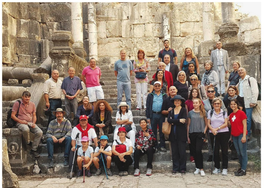
«Les amis de la Suisse» dans les ruines de Niha, construit aux II e et III e siècles.