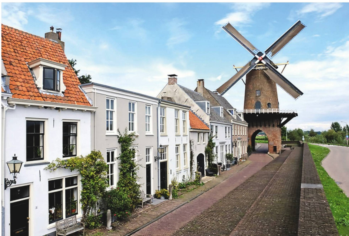
Ausflugsziel Wijk bij Duurstede.