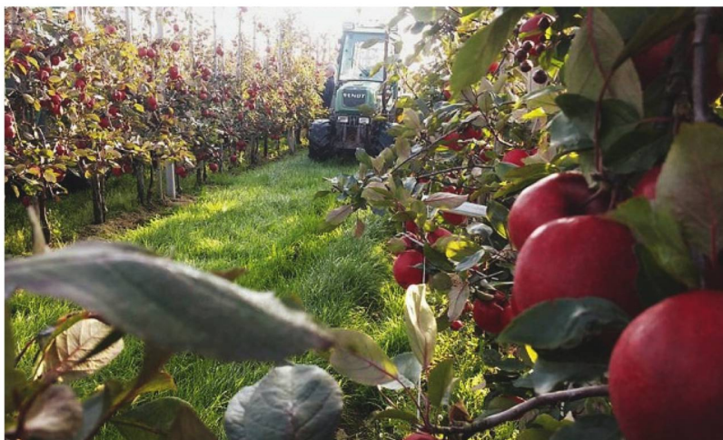
Auf einer Plantage des Schweizer Originals «Redlove».