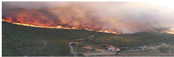
Veerheerende Waldbrände in Portugal. Incendies dévastateurs au Portugal.

Schweizer Superpumas im Einsatz Mit drei Helikoptern Superpuma zur Walbrandbekämpfung und einem Team von 30 Personen leistete die Schweiz letztes Jahr einem portugiesischen Hilfeaufruf spontan Folge.