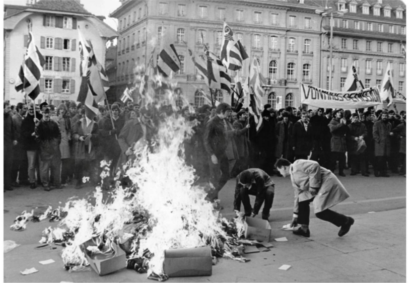
Zeiten der Gewalt: jurassische Separatisten an einer unbewilligten Demonstration im November 1969 vor dem Bundeshaus in Bern.

2012: Die Kantone Bern und Jura schliessen ein Abkommen, um den Jurakonflikt definitiv zu beenden. Das Abkommen sieht ein mehrstufiges Verfahren mit regionalen und kommunalen Abstimmungen vor.