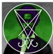
ZEAL & ARDOR: «Devil is Fine» (Radicatis).