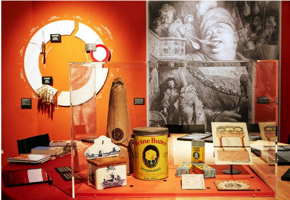
Die Ausstellung greift auch die Themenbereiche Hunger und Überfluss auf.