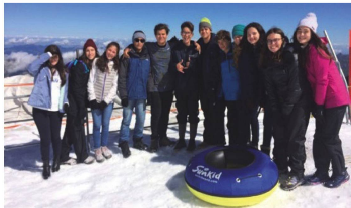
A turma na montanha Titlis