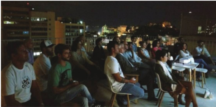
Apresentação do documentário Uma Gota, no terraço da swissnex.