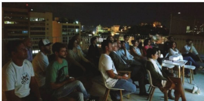
Apresentação do documentário Uma Gota, no terraço da swissnex.