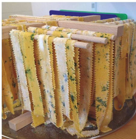
Der Phantasie sind keine Grenzen gesetzt - Teigwaren gibt es in verschiedensten Formen und Farben.

L'imagination n'a pas de limite : on trouve des pâtes de toutes formes et toutes couleurs.