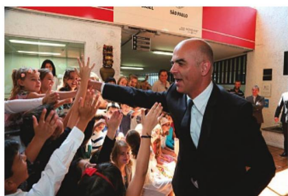
Conselheiro Federal, Sr. Alain Berset com alunos

A Escola Suíço-Brasileira sente-se muito