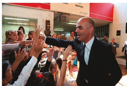
Conselheiro Federal, Sr. Alain Berset com alunos

A Escola Suíço-Brasileira sente-se muito