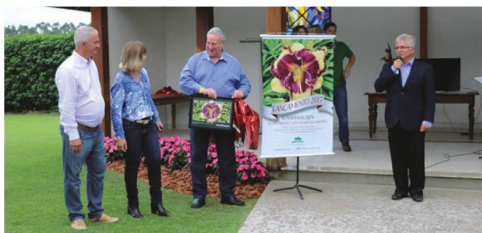
Membros do Comitê Brasil/Suíça

No 15º Festival de Hemerocalis, foi lançada uma flor com o nome de Schaffhausen, em homenagem aos imigrantes Suíços, que vieram do Canton de Schaffhausen, para a cidade de Joinville, em Santa Catarina, no Brasil. Foram estes primeiros imigrantes que ajudaram a fundar, no dia 09 de março de 1850, a cidade denominada, hoje, de Joinville.