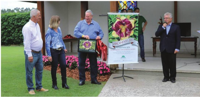
Membros do Comitê Brasil/Suíça

No 15º Festival de Hemerocalis, foi lançada uma flor com o nome de Schaffhausen, em homenagem aos imigrantes Suíços, que vieram do Canton de Schaffhausen, para a cidade de Joinville, em Santa Catarina, no Brasil. Foram estes primeiros imigrantes que ajudaram a fundar, no dia 09 de março de 1850, a cidade denominada, hoje, de Joinville.