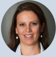
Standpunkt Chantal Galladé , SP-Nationalrätin Kanton Zürich, Mitglied der Sicherheitspolitischen Kommission des Nationalrats:

«Ohne Sicherheit gibt es keine Lebensqualität. Sicherheit ist vorab Ergebnis einer Gesellschaft, die für die Freiheit aller einsteht – und eines intakten Rechtsstaates und guter Regierungsführung. Dazu gehört aber auch die Fähigkeit der legitimen Staatsgewalt, in den Schranken der Menschenrechte den Schutz der Zivilbevölkerung mit (bewaffneter) Gewalt durchzusetzen. Waffen an jene zu liefern, die Gewähr bieten, diese allein zum Schutz der Zivilbevölkerung und Wahrung der Menschenrechte einzusetzen, ist legitim. Auf diesen Überlegungen beruht auch die Schweizer Gesetzgebung. Die Kriegsmaterialverordnung verbietet zwingend Geschäfte, wenn das Bestimmungsland in einen internen oder internationalen bewaffneten Konflikt verwickelt ist oder wenn das Bestimmungsland Menschenrechte systematisch und schwerwiegend verletzt. Umso unerträglicher ist der moralische, politische und rechtliche Fehlentscheid des Bundesrates vom 20. April 2016, die laufenden Kriegsmaterialexporte nach jener Kriegsallianz nicht zu stoppen, die in Jemen eine katastrophale humanitäre Lage ausgelöst haben, und diesen Krieg führenden Staaten mit windigen Begründungen gar neue Rüstungsexporte zu bewilligen. Geschäfte, an denen Blut klebt, sind der humanitären Schweiz unwürdig und nicht akzeptabel.»