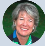
Standpunkt Corina Eichenberger , FDP-Nationalrätin Kanton Aargau, Co-Präsidentin Arbeitskreis Sicherheit und Wehrtechnik, Präsidentin Sicherheits- politische Kommission des Nationalrats:

«Ohne Sicherheit gibt es keine Lebensqualität. Sicherheit ist vorab Ergebnis einer Gesellschaft, die für die Freiheit aller einsteht – und eines intakten Rechtsstaates und guter Regierungsführung. Dazu gehört aber auch die Fähigkeit der legitimen Staatsgewalt, in den Schranken der Menschenrechte den Schutz der Zivilbevölkerung mit (bewaffneter) Gewalt durchzusetzen. Waffen an jene zu liefern, die Gewähr bieten, diese allein zum Schutz der Zivilbevölkerung und Wahrung der Menschenrechte einzusetzen, ist legitim. Auf diesen Überlegungen beruht auch die Schweizer Gesetzgebung. Die Kriegsmaterialverordnung verbietet zwingend Geschäfte, wenn das Bestimmungsland in einen internen oder internationalen bewaffneten Konflikt verwickelt ist oder wenn das Bestimmungsland Menschenrechte systematisch und schwerwiegend verletzt. Umso unerträglicher ist der moralische, politische und rechtliche Fehlentscheid des Bundesrates vom 20. April 2016, die laufenden Kriegsmaterialexporte nach jener Kriegsallianz nicht zu stoppen, die in Jemen eine katastrophale humanitäre Lage ausgelöst haben, und diesen Krieg führenden Staaten mit windigen Begründungen gar neue Rüstungsexporte zu bewilligen. Geschäfte, an denen Blut klebt, sind der humanitären Schweiz unwürdig und nicht akzeptabel.»