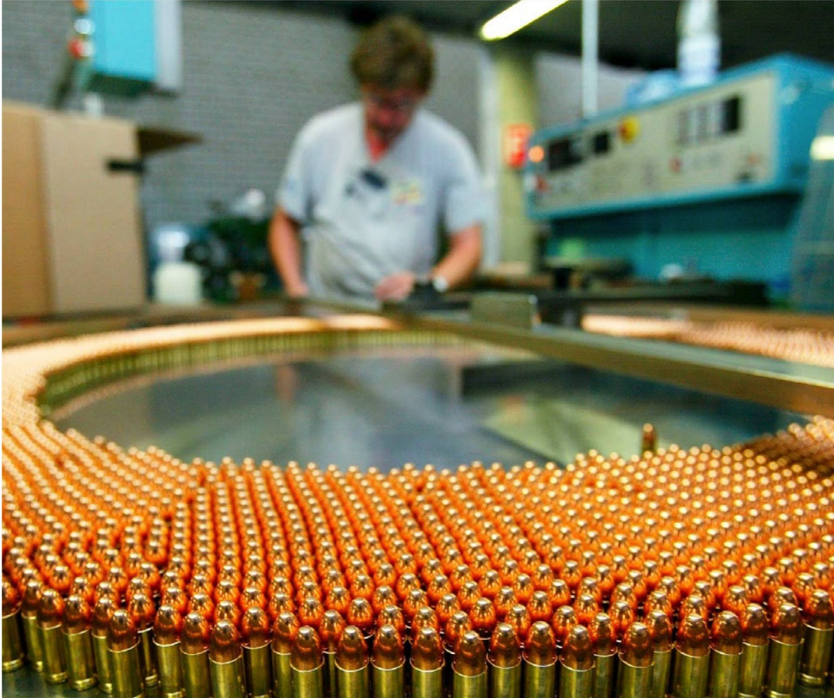
Die Schweizer Waffenexporte geschehen im Spannungsfeld von Wirtschaft, Ethik und Moral. Im Bild: Kontrolle von 9-Millimeter-Patronen in der Munitionsabteilung der Ruag.

Waffenexporte sind in der Schweiz ein politischer Dauerbrenner. Der Jemen-Konflikt hat die Debatte nun neu befeuert – und auch den Bundesrat vor eine Belastungsprobe gestellt. Eine Auslegeordnung.