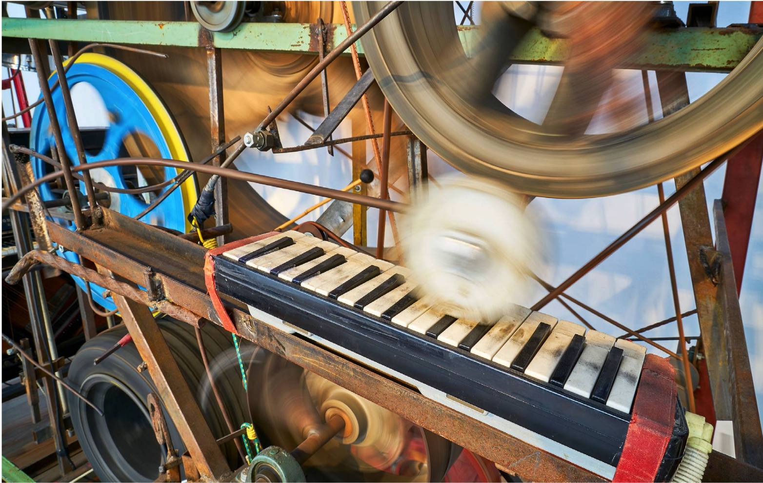
Ein Rollen über den Tasten: Die Dynamik der klingenden Werke Tinguelys offenbart sich oft erst im Detail.