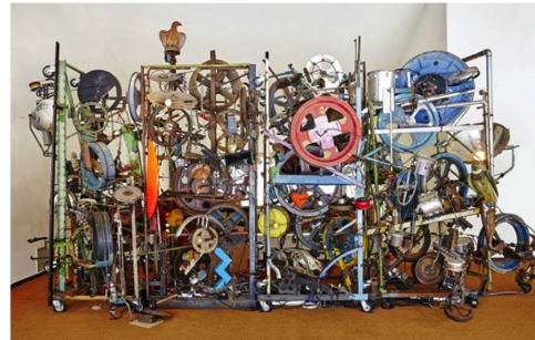
Wirres Gebilde aus tausend Teilen: eine Musikmaschine von 1984.