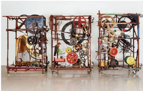
Die erste Musikmaschine der vierteiligen Serie «Méta-Harmonie» stammt von 1978.