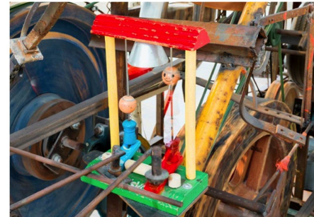
In Tinguelys Musikmaschinen können die alltäglichsten Gegenstände beeinflussen.