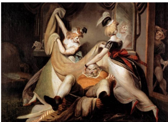
Heinrich Füssli: «Falstaff im Wäschekorb» (1792).