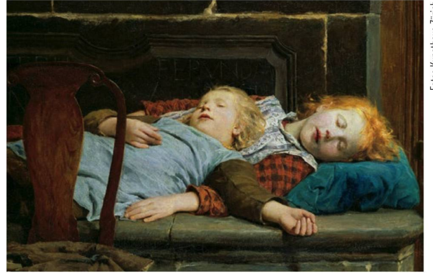
Albert Anker: «Zwei schlafende Mädchen auf der Ofenbank» (1895).