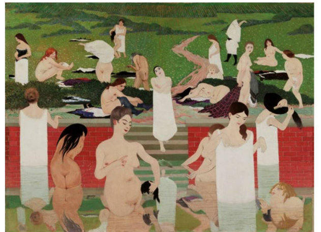
Félix Vallotton: «Das Bad am Sommerabend» (1892).