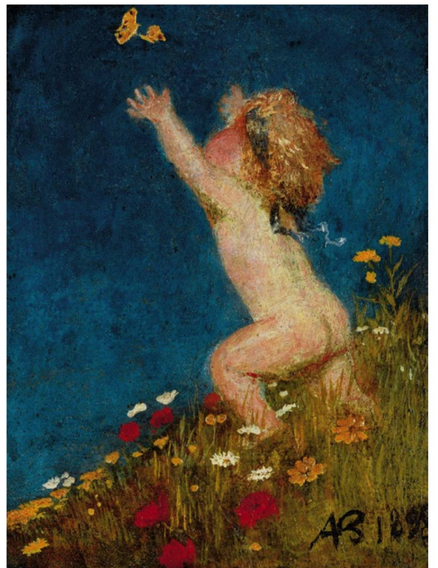
Arnold Böcklin: «Putto und Schmetterling» (1895).