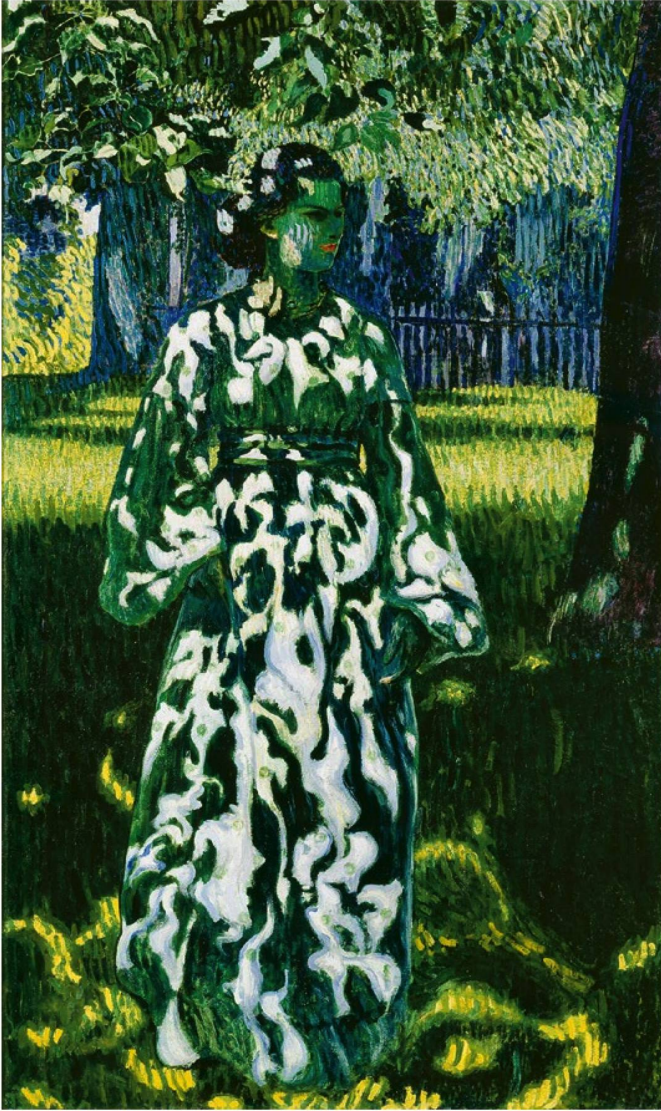
Cuno Amiet: «Sonnenflecken» (1904).