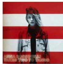
ANNA ROSSINELLI: «Takes Two To Tango», Universal Music.

Die Aufregung war gross, als Anna Rossinelli ihr neues Projekt ankündigte: Sie werde mit ihrer Band während drei Monaten durch die USA ziehen, dort nach den Wurzeln der Rockmusik forschen, sich von Gospel und Blues inspirieren lassen, am Ende in New York ins Studio gehen und das Resultat in einem Dokumentarfilm sowie auf einem Album verewigen.