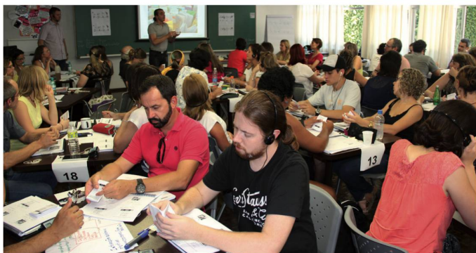
Escola Suíça SP

O Colégio Suíço-Brasileiro em Curitiba e a Escola Suíço-Brasileira de São Paulo, que são reconhecidos pelo Governo Suíço, introduziram no Brasil o sistema suíço de qualidade de ensino - IQES. Ambas as escolas são parceiras oficiais desde 2015.