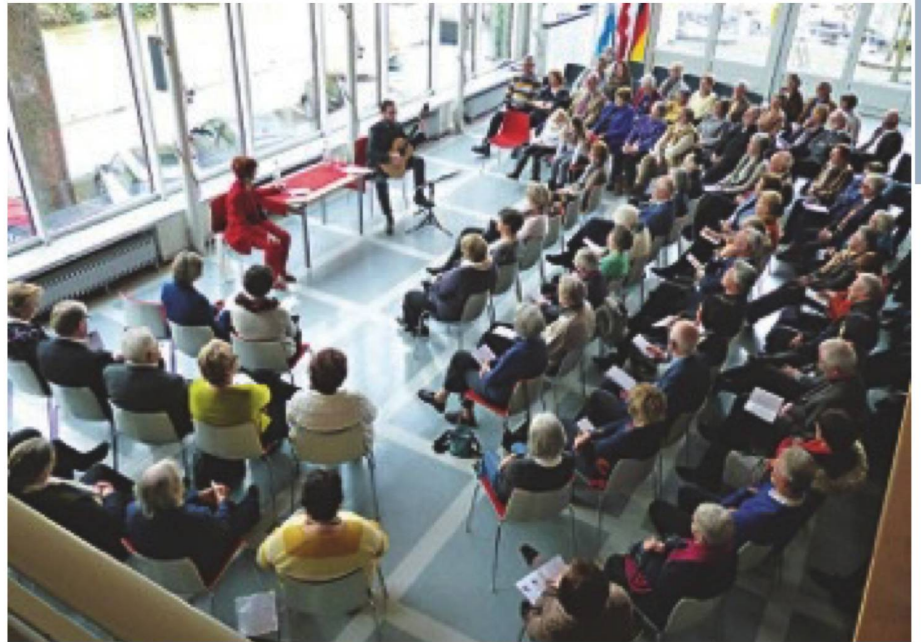
Sonntagsmatinée mit 120 Gästen im Schweizer Haus München: Kästners Gedichtzyklus «Die 13 Monate» entstand im Auftrag der Schweizer Illustrierten Zeitung in den 1950er Jahren.

Die nächsten Monate sind abwechslungsreich geplant – wir freuen uns auf interessante Vereinsabende z.B. mit einem