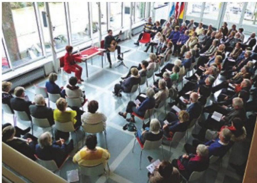
Sonntagsmatinée mit 120 Gästen im Schweizer Haus München: Kästners Gedichtezyklus «Die 13 Monate» entstand im Auftrag der Schweizer Illustrierten Zeitung in den 1950er Jahren.

Die nächsten Monate sind abwechslungsreich geplant – wir freuen uns auf interessante Vereinsabende z.B. mit einem