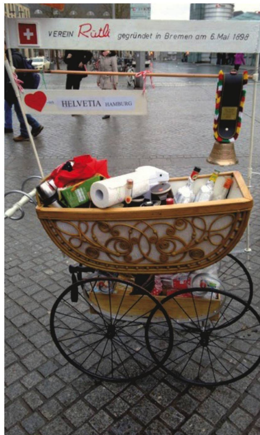
Mit pittoreskem Kinderwagen unterwegs: Die Bremer und Hamburger Schweizer auf Kohl- und Pinkelfahrt