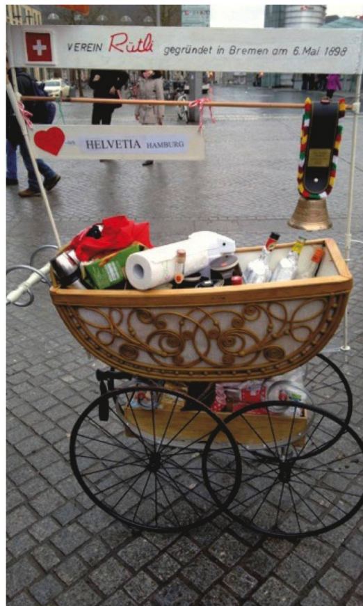
Mit pittoreskem Kinderwagen unterwegs: Die Bremer und Hamburger Schweizer auf Kohl- und Pinkelfahrt