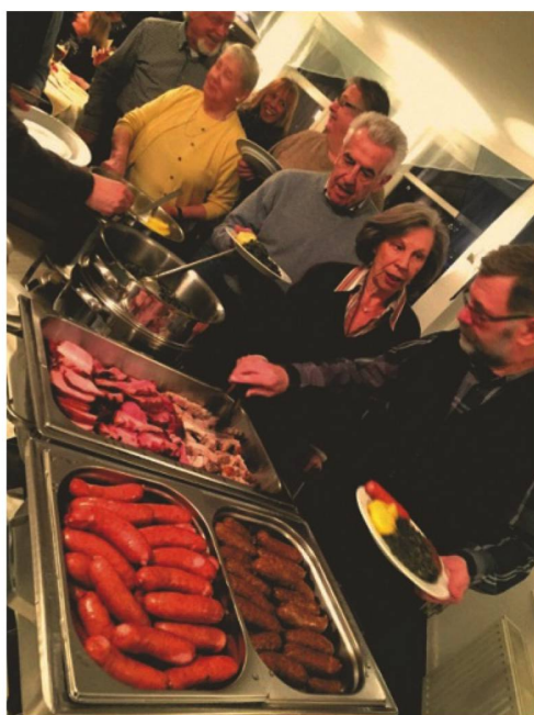
Pinkel (vorne rechts) besteht im Wesentlichen aus Speck und Gersten- oder Hafergrütze