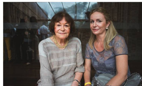
Fotografa Claudia Andujar e Astrid Boller - Cônsul honorária de BH

O Instituto Inhotim, em Brumadinho, próximo a Belo Horizonte, inaugurou no dia 26 de novembro sua 19ª galeria permanente, dedicada a fotografa suíça radicada no Brasil, desde 1955, Claudia Andujar. O pavilhão de 1600m é o segundo maior do parque e exibe 400 fotografias realizadas pela artista entre 1970 e 2010 na Amazônia e com os índios Yanomami. Claudia Andujar viveu temporadas na região e realizou diversas visitas posteriores. Grande parte das fotografias é inédita, como as séries Rio Negro de 1970 e Toototobi de 2010.