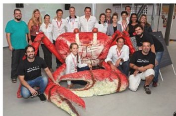
A equipe de Race For Water com a equipe da swissnex e parceiros locais

A swissnex Brazil, e swissando apresentaram, em novembro, no Rio de Janeiro, a Race for WaterOdyssey, expedição que produziu o primeiro levantamento global da poluição por plásticos nos oceanos. A equipe de pesquisadores da expedição, lançada em 15 de março deste ano, coletou dados ao longo de 32 mil milhas náuticas (pouco mais que uma volta em torno da Terra), a bordo do barco MOD70, um veleiro trimarã de alta tecnologia.