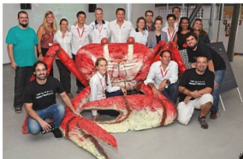
A equipe de Race For Water com a equipe da swissnex e parceiros locais

A swissnex Brazil, e swissando apresentaram, em novembro, no Rio de Janeiro, a Race for WaterOdyssey, expedição que produziu o primeiro levantamento global da poluição por plásticos nos oceanos. A equipe de pesquisadores da expedição, lançada em 15 de março deste ano, coletou dados ao longo de 32 mil milhas náuticas (pouco mais que uma volta em torno da Terra), a bordo do barco MOD70, um veleiro trimará de alta tecnologia.