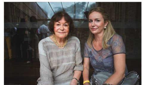
Fotografa Claudia Andujar e Astrid Boller - Cônsul honorária de BH

O Instituto Inhotim, em Brumadinho, próximo a Belo Horizonte, inaugurou no dia 26 de novembro sua 19ª galeria permanente, dedicada a fotografa suíça radicada no Brasil, desde 1955, Claudia Andujar. O pavilhão de 1600m é o segundo maior do parque e exibe 400 fotografias realizadas pela artista entre 1970 e 2010 na Amazônia e com os índios Yanomami. Claudia Andujar viveu temporadas na região e realizou diversas visitas posteriores. Grande parte das fotografias é inédita, como as séries Rio Negro de 1970 e Toototobi de 2010.