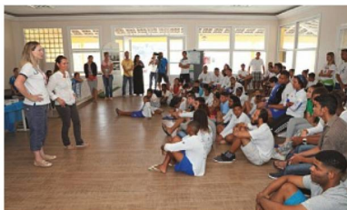
Sensibilização de crianças e jovens em Niterói no Projeto Graiel

A chegada da expedição no Rio deu-se início na campanha “Mar sem Lixo. Mar da Gente.”, que teve ações de sensibilização e seminários científicos em torno da causa do lixo nos oceanos no Rio e em Niterói. A swissnex Brazil e a swissando organizaram eventos como um workshop sobre o conceito “cradle to cradle” (do berço ao berço), no Instituto Europeo di Design”, na Urca, uma coleta de lixo durante uma corrida de Standup Paddle na praia de Itaipu em Niterói e uma conferência de dois dias que juntou os melhores pesquisadores brasileiros e suíços para debater soluções para eliminar o lixo marinho.