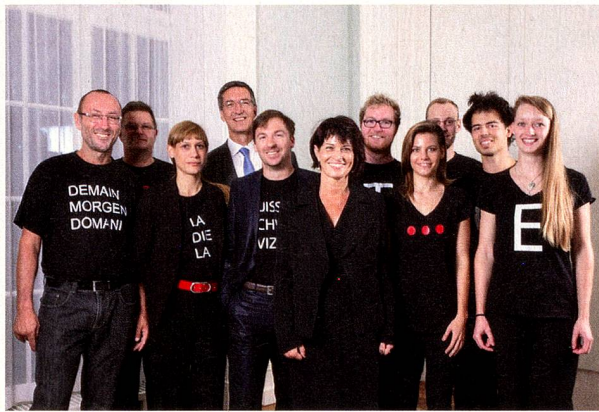
Das hepia-Siegerteam mit Bundesrätin Doris Leuthard

Naturräume mitten in der Stadt, weniger Verkehr, mehr Sinn für die Gemeinschaft: Dieses Szenario steht im Zentrum des Projekts «Swisstopia», mit dem die Haute école du paysage, d'ingénierie et d'architecture (hepia) aus Genf den Ideenwettbewerb «morgen? Die Schweiz» gewonnen hat.