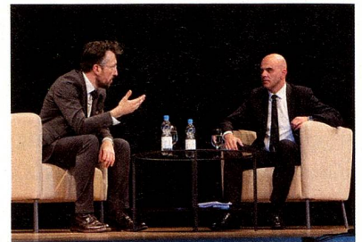
Bundesrat Alain Berset im Gespräch mit dem Autor Lukas Bärfuss