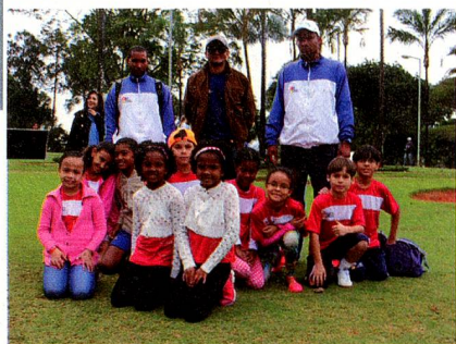
Crianças que participaram da Copa Suíça

O evento, tanto para os participantes adultos como para as crianças, foi um grande sucesso, e a Embaixada da Suíça espera poder voltar em breve com uma nova edição.