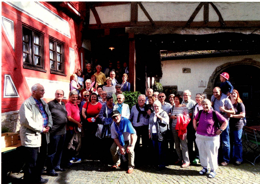
40 Gäste der Schweizer Gesellschaft Stuttgart vor dem «Klösterle».