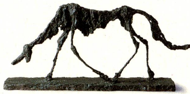
Alberto Giacometti, Le Chien, 1951, Bronze, Collection Fondation Marguerite et Aimé Maeght, Saint-Paul