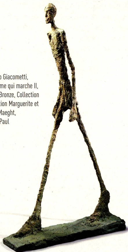
Alberto Giacometti, L'Homme qui marche II, 1960, Bronze, Collection Fondation Marguerite et Aimé Maeght, Saint-Paul