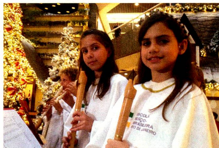
ORQUESTRA DE FLAUTA DE ESCOLA SUÍÇO-BRASILEIRA RJ

Este ano, os alunos da Escola Suíço-Brasileira Rio de Janeiro foram convidados para abrilhantar o evento de inaugura-