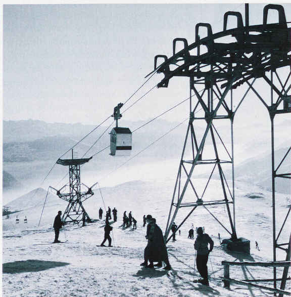
Die erste Gondelbahn der Schweiz in Crans-Montana, 1950