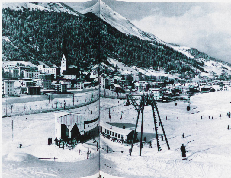
Der Bolgenlift in Davos war der erste Bügelskifift der Welt aus dem Winter 1934/35