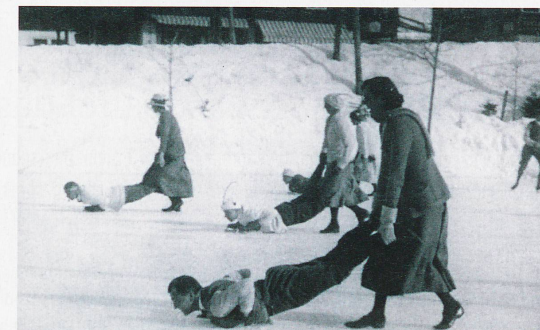
Eisspiele (Gymkhanas) in Grindelwald