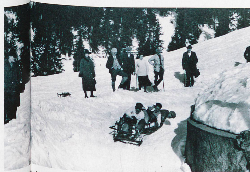
Wilde Schifffahrt in Crans-Montana