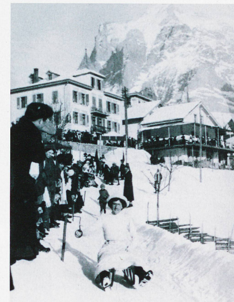
Beim Schlittenrennen Village Run in Grindelwald