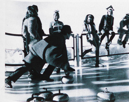
James Bond spielt Curling, 1968