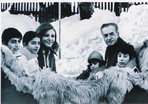
Der Schah von Persien mit Familie in St. Moritz, 1975