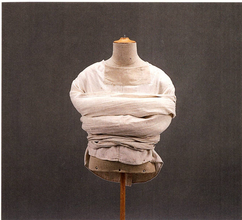
Zwangsjacke aus der psychiatrischen Anstalt Waldau bei Bern

der globale Handel knüpfte die Nationen derart aneinander, dass kein Krieg mehr möglich sei. Aber es gab eben auch Leute wie Friedrich Engels, den Gesellschaftstheoretiker und Gefährten von Marx, der schon 1887 einen «Weltkrieg von einer bisher nie gekannten Ausdehnung und Heftigkeit» vorausgesehen hatte: «Acht bis zehn Millionen Soldaten werden sich untereinander abwürgen.»