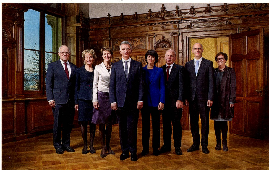
Im Bundesratszimmer: Johann N. Schneider-Ammann, Eveline Widmer-Schlumpf, Simonetta Sommaruga (Vizepräsidentin), Bundespräsident Didier Burkhalter, Doris Leuthard, Ueli Maurer, Alain Berset, Bundeskanzlerin Corina Casanova, (von links nach rechts)