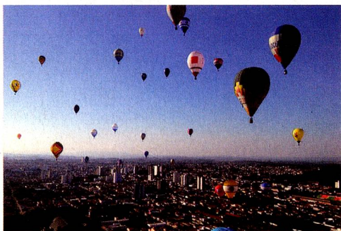
Céu de Rio Claro durante a competição

Os balões partiram do Aeroclube de Rio Claro e por algumas vezes, fize-