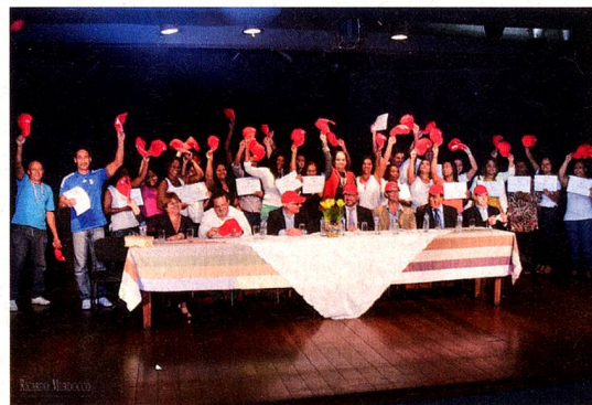
Entrega dos diplomas

O curso, no qual os participantes aprenderam a organizar e arrumar um quarto de hotel, durou 40 dias. Foi um sucesso! A maior parte dos participantes conseguiu um emprego na indústria hoteleira logo, após o curso.