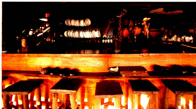
Palaphita Kitch

Queremos apresentar uma Suíça com a qual todos possam se identificar. É a hora de mostrar para os brasileiros que qualidade e precisão não precisam ser enfadonhas e que a informalidade combina com a sofisticação. Com esse projeto, temos a melhor oportunidade e visibilidade para fortalecer a sinergia entre o Brasil e a Suíça de uma forma positiva.