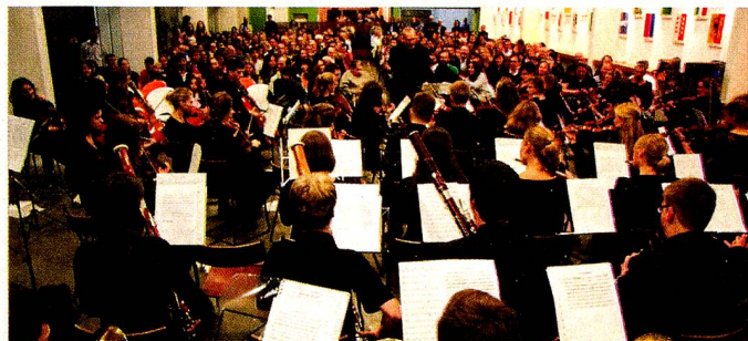
Orquestra Sinfônica Jovem da Basileia. www.esbsp.com.br