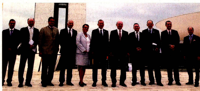
Delegação em Brasília

Uma delegação da Comissão de política exteriores do Senado suíço (CPE-E) sob a chefia do senhor Hannes Germann, Presidente da Comissão e Vice-Presidente do Senado suíço, esteve em visita oficial de uma semana ao Brasil em outubro de 2013. A delegação da CPE-E consagrou principalmente a visita, que a conduziu por São Paulo, Brasília, Rio de Janeiro e Foz do Iguaçu, às rela-