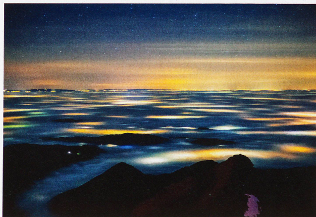
Nebelmeer über dem Mittelland, aufgenommen vom Säntis, 24. November 2011