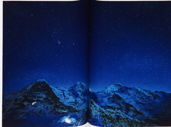
Sternbild Orion über Eiger, Mönch und Jungfrau, aufgenommen vom Männlichen, 31. Januar 2011