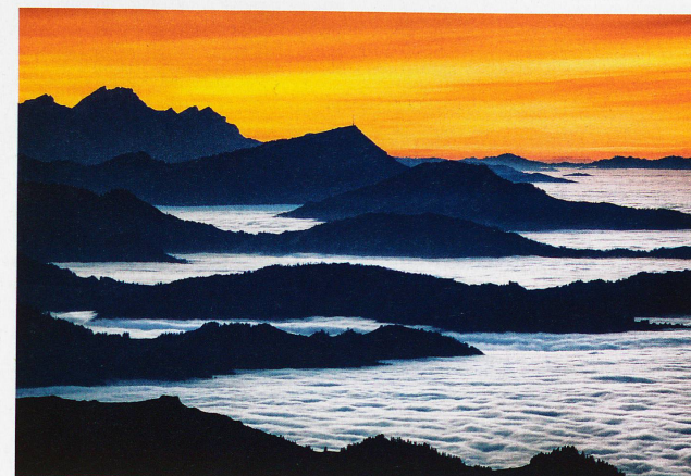
Nebelmeer über den Voralpen, mit Pilatus und Rigi, aufgenommen vom Säntis, 24. November 2011