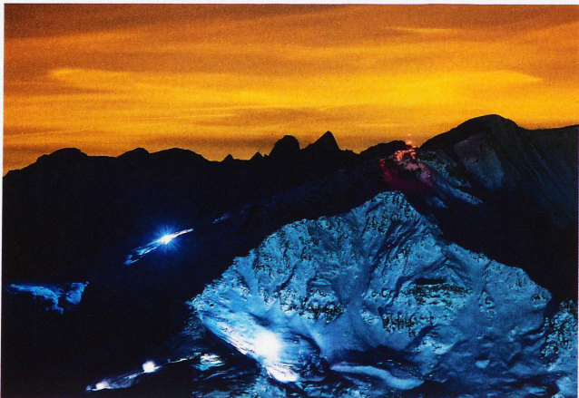
Pistenfahrzeuge und Schneekanonen am Corvatsch, aufgenommen vom Piz Nair, 12. Dezember 2012