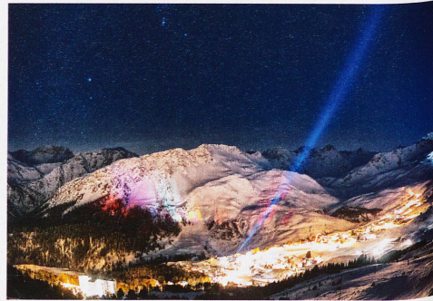
Silvesternacht in Arosa, aufgenommen von Tschuggen, 1. Januar 2012

Buch: «Helvetia by night»; Verlag NZZ libro, Zürich, 2013; 192 Seiten, 100 Abbildungen mit fototechnischen Erklärungen im Anhang. CHF 84.– Mehr unter: helvetiabynight.com/