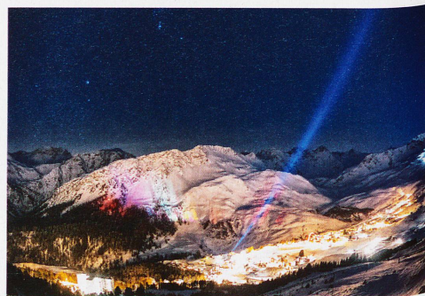
Silvesternacht in Arosa, aufgenommen von Tschuggen, 1. Januar 2012

Buch: «Helvetia by night»; Verlag NZZ libro, Zürich, 2013; 192 Seiten, 100 Abbildungen mit fototechnischen Erklärungen im Anhang. CHF 84.– Mehr unter: helvetiabynight.com/