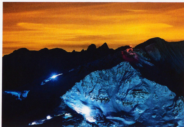
Pistenfahrzeuge und Schneekanonen am Corvatsch, aufgenommen vom Piz Nair, 12. Dezember 2012