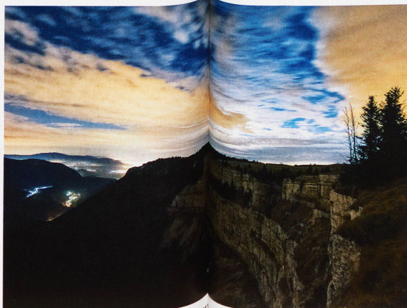
Creux du Van, aufgenommen am 20. November 2011