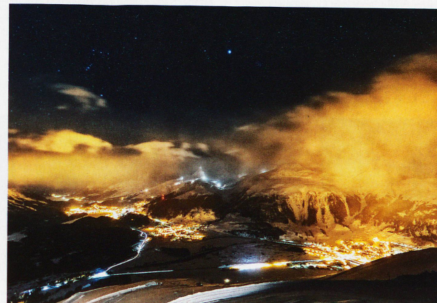
St. Moritz, Celerina und Samedan, aufgenommen von Muottas Muragl, 9. Februar 2013