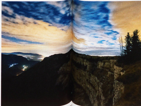
Creux du Van, aufgenommen am 20. November 2011