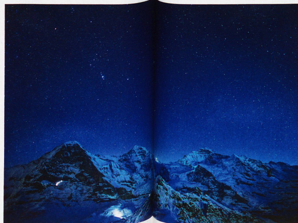
Sternbild Orion über Eiger, Mönch und Jungfrau, aufgenommen vom Männlichen, 31. Januar 2011