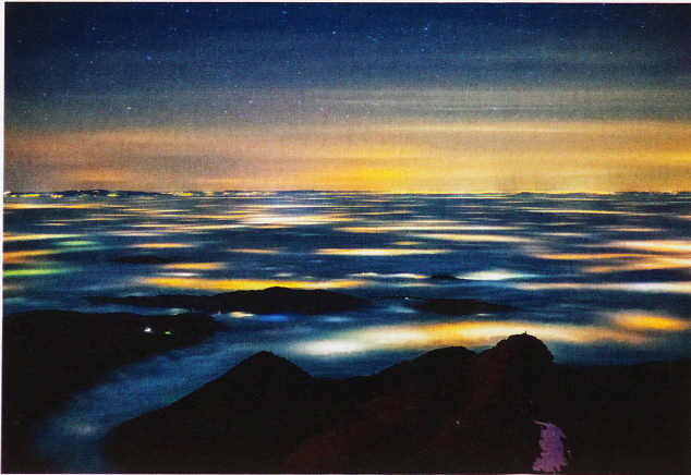
Nebelmeer über dem Mittelland, aufgenommen vom Säntis, 24. November 2011