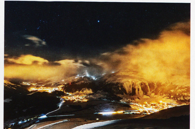
St. Moritz, Celerina und Samedan, aufgenommen von Muottas Muragl, 9. Februar 2013