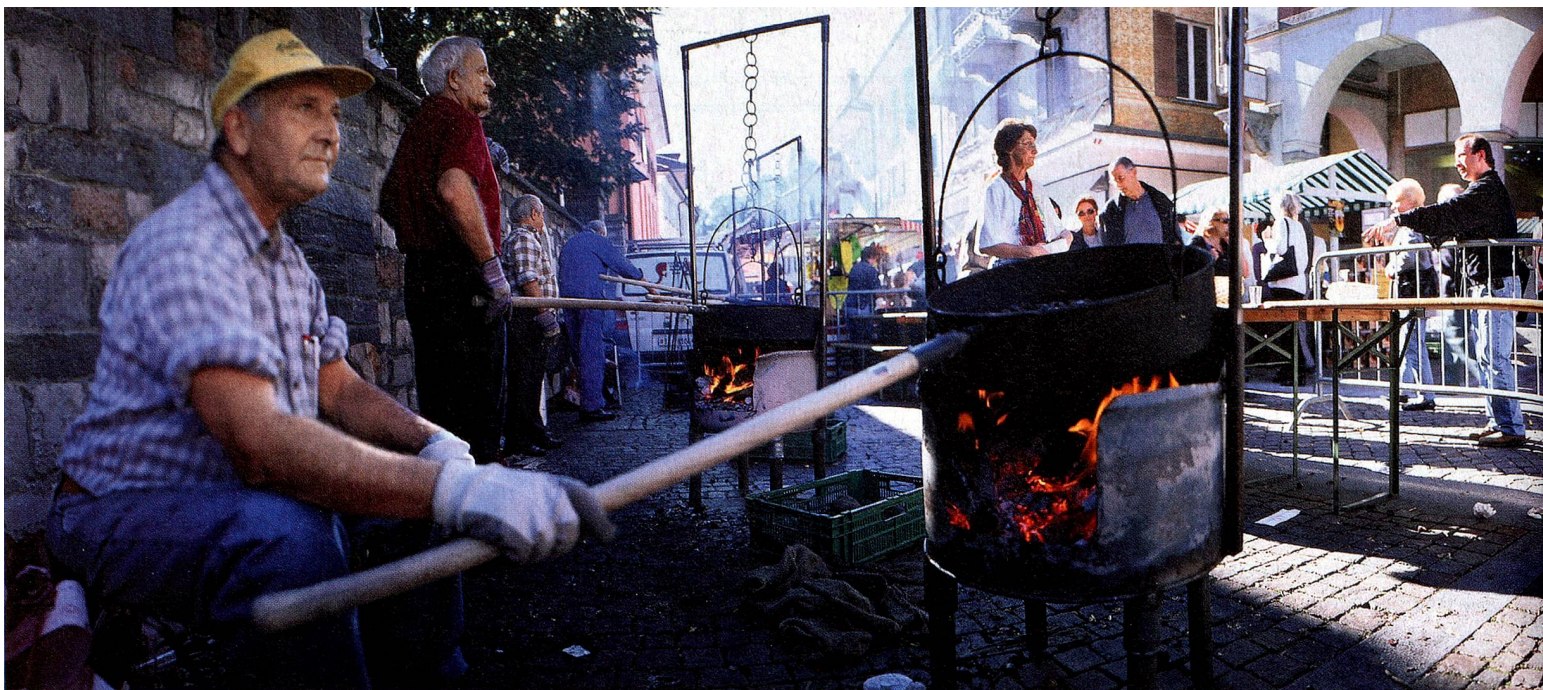
Castagnata, Ascona, Tessin