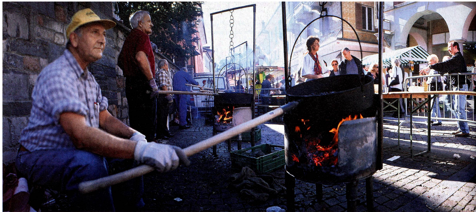
Castagnata, Ascona, Tessin