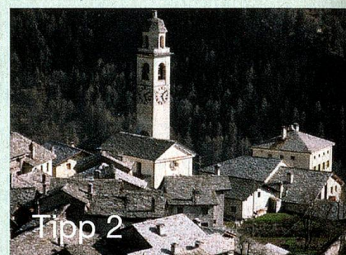
Tipp 2 MySwitzerland.com Webcode: A147088

Das Bergell im Süden Graubündens ist ein Paradies für Wanderer und Alpinisten, aber auch nie versiegende Inspirationsquelle vieler Künstler. In diesem idyllischen Tal verbrachte der berühmte Alberto Giacometti seine frühen Kinderjahre.