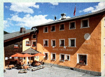
MySwitzerland.com Webcode: A54633

Melden Sie sich bis zum 30. September 2013 auf www.MySwitzerland.com/aso an und gewinnen Sie 2 Nächte für 2 Personen im Typischen Schweizer Hotel Landgasthof Staila*** in Fuldera für einen atemberaubenden Aufenthalt im Val Müstair.