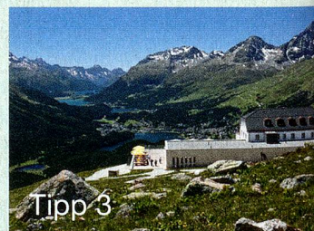
Tipp 3 MySwitzerland.com Webcode: C58592

Hoch über einer der schönsten Landschaften des Engadins, St. Moritz, liegt das Hotel Muot-tas Muragl auf 2456 Metern ü. M. Mit seinem modernen alpinen Design, einem breiten gastronomischen Angebot und fantastischen Ausflugsmöglichkeiten ist es einzigartig.