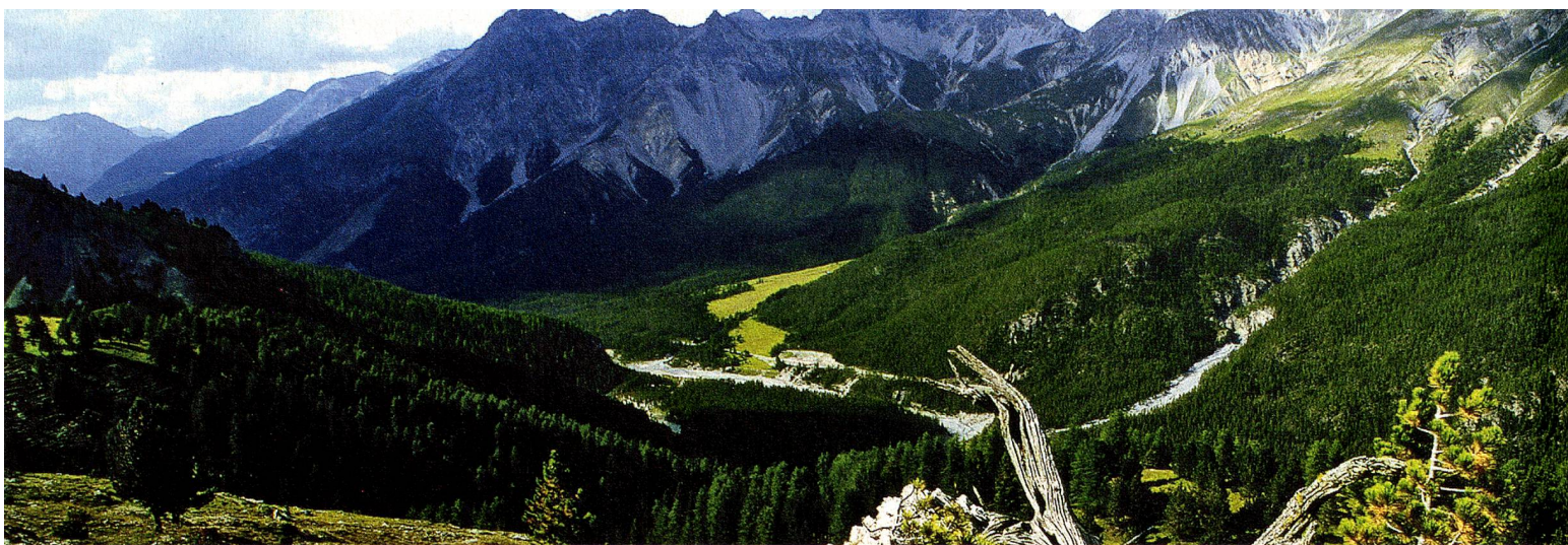
Schweizerischer Nationalpark, Graubünden