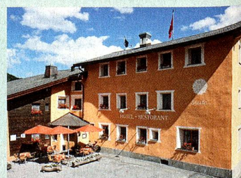
MySwitzerland.com Webcode: A54633

Melden Sie sich bis zum 30. September 2013 auf www.MySwitzerland.com/aso an und gewinnen Sie 2 Nächte für 2 Personen im Typischen Schweizer Hotel Landgasthof Staila*** in Fuldera für einen atemberaubenden Aufenthalt im Val Müstair.