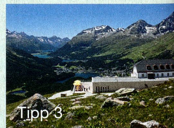
MySwitzerland.com Webcode: C58592

Hoch über einer der schönsten Landschaften des Engadins, St. Moritz, liegt das Hotel Muotatas Muragl auf 2456 Metern ü. M. Mit seinem modernen alpinen Design, einem breiten gastronomischen Angebot und fantastischen Ausflugsmöglichkeiten ist es einzigartig.