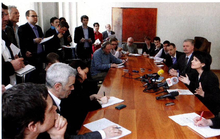
14. März 2011: Bundesrätin Doris Leuthard erklärt Medienvertretern im Bundeshaus die Pläne der Regierung zur Energiewende