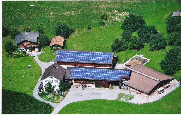
Bilder der Zukunft: Sonnenkollektoren auf den Dächern in Schiers (GR). Landschaft mit Windturbinen in Süddeutschland und Fassaden älterer Bauten, neu verkleidet mit Kollektoren wie bei der Überbauung Sihlweid in Zürich