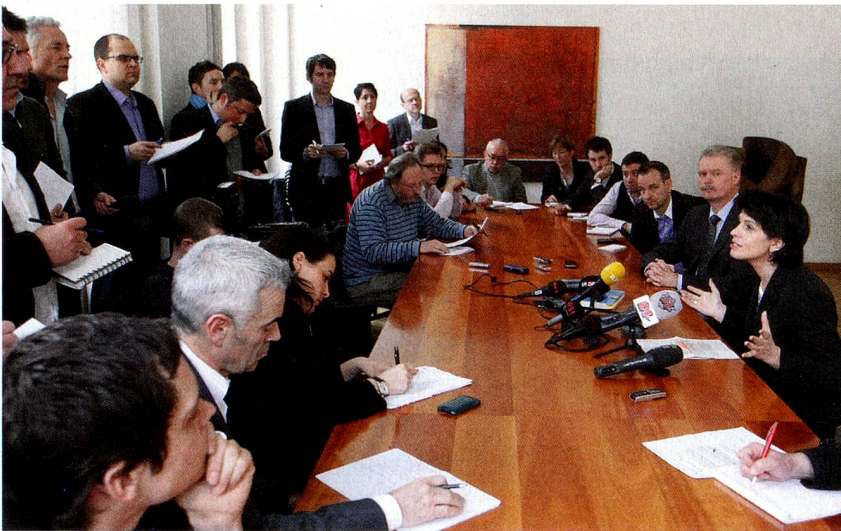
14. März 2011: Bundesrätin Doris Leuthard erklärt Medienvertretern im Bundeshaus die Pläne der Regierung zur Energiewende