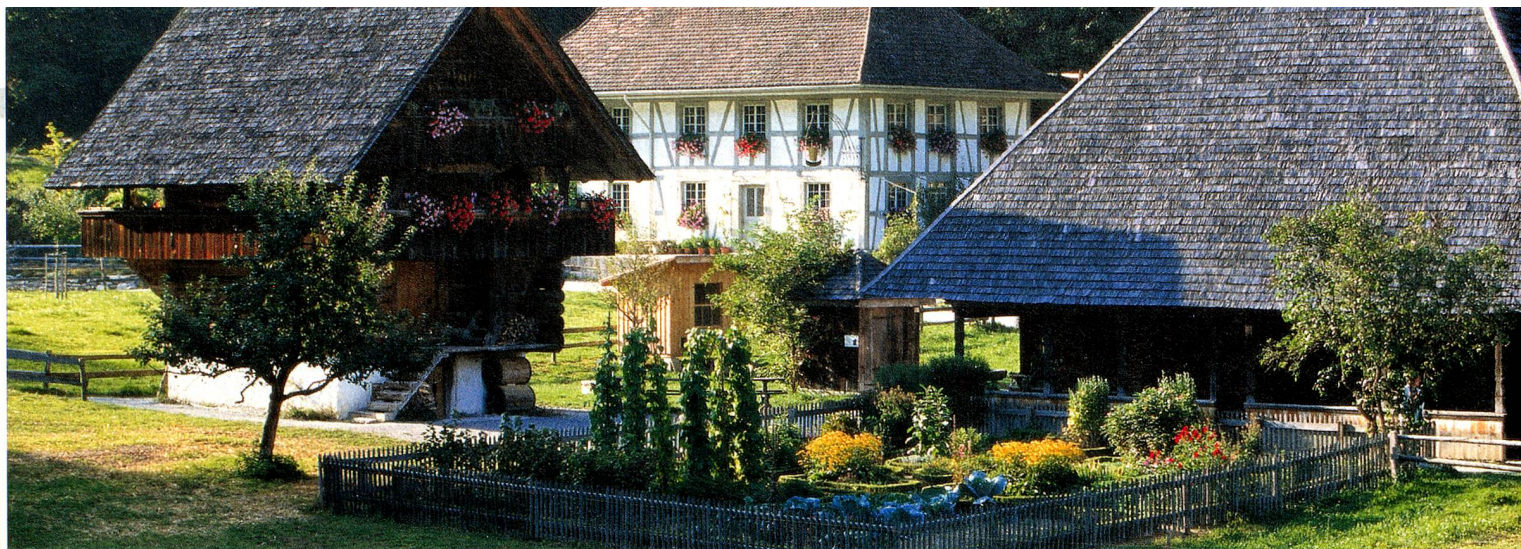
Ballenberg, das Freilichtmuseum für ländliche Kultur, Berner Oberland