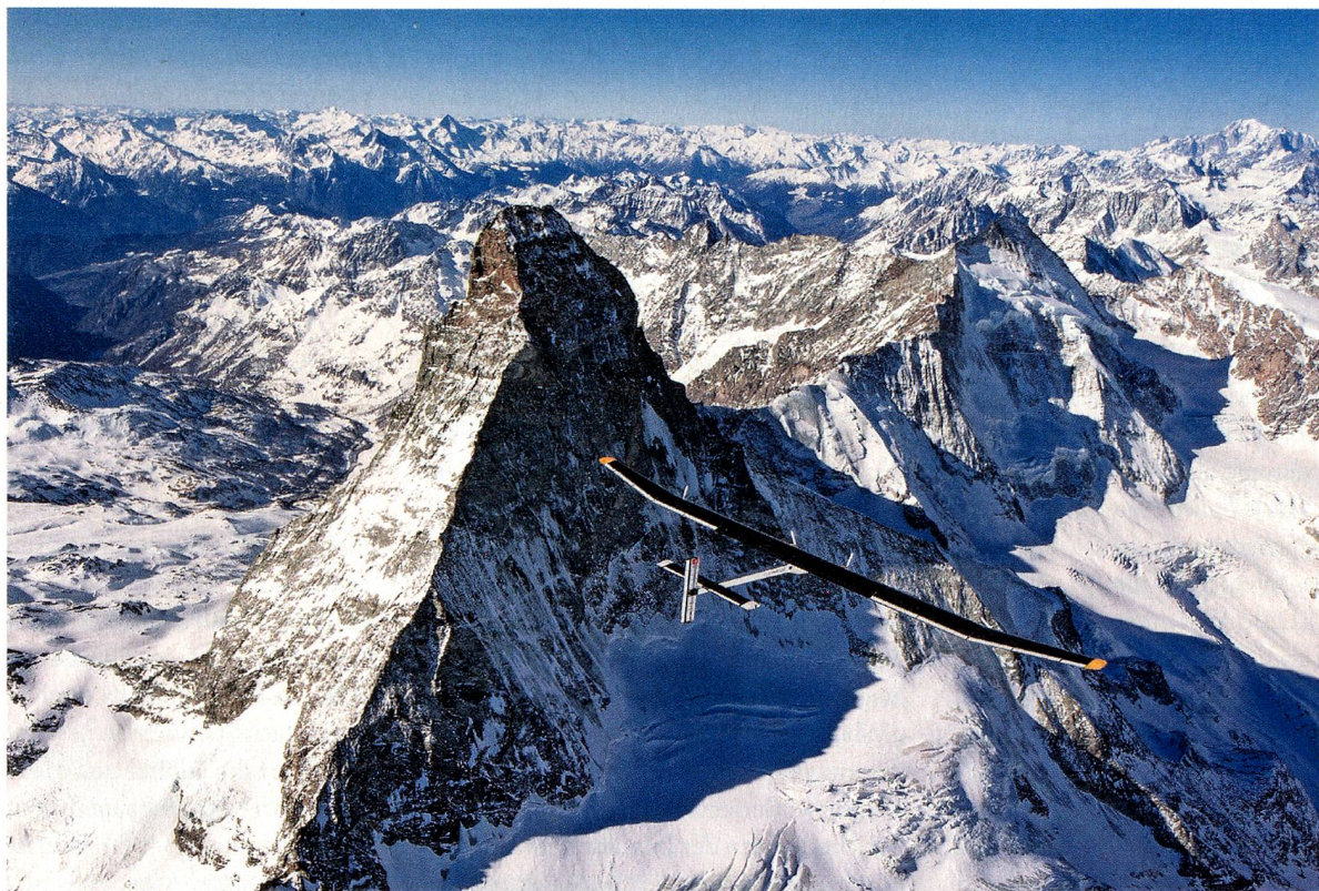
Die HB-SIA auf einem Flug über den Alpen bei Zermatt