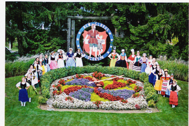
In New Glarus, gegründet 1845, werden viele Traditionen seit Generationen weitergeführt