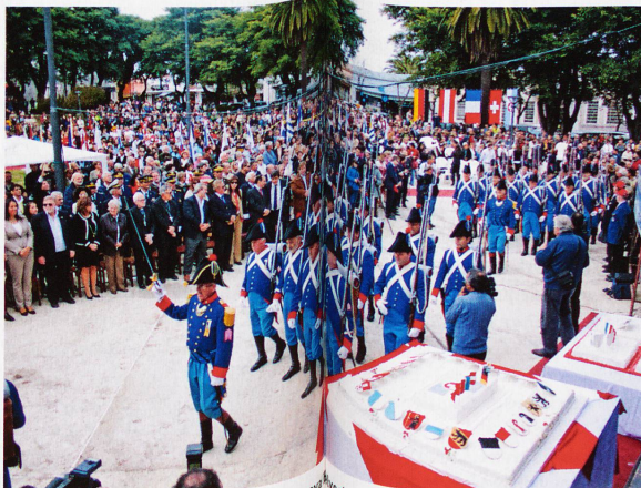
2012 wurde mit Militärparaden 150 Jahre Nueva España in Uruguay gefeiert. Etwa 1000 Auslandschweizer leben derzeit in diesem amerikanischen Land