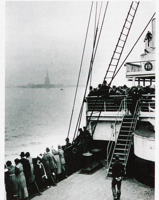
Auswanderer auf einem Schiff vor New York, aufgenommen 1915