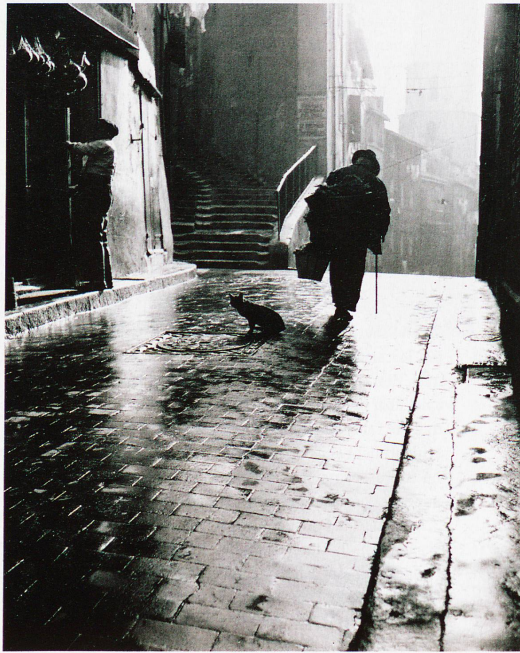
Gasse in Marseille am frühen Morgen

zeigt anhand von Einzelschicksalen und Biografien in zwei Museen, was Auswanderung bedeutet und wie die Ausgewanderten in aller Welt ein Stück alte Heimat in eine neue Heimat zu integrieren versuchen. Ausstellung: «Appenzeller Auswanderung – Von Not und Freiheit» im Volkskunde-Museum in Stein und im Brauchtummuseum in Urnäsch. Dauer: bis 27. Oktober in Stein, bis 13. Januar 2014 in Urnäsch. www.appenzeller-museum-stein.ch ; www.museum-urnaes.ch .