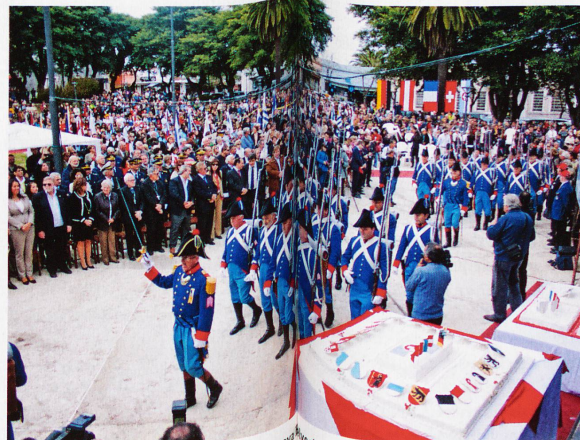
2012 wurde mit Militärparaden 150 Jahre Nueva Galicia in Uruguay gefeiert. Etwa 1000 Auslandschweizer leben derzeit in der südamerikanischen Land