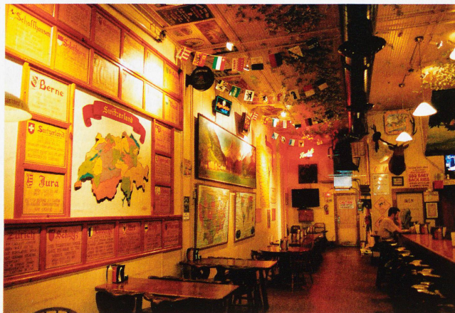
«The Original Baumgartner», die Schweizer Taverne mit Käseladen in Wisconsin existiert seit 1931