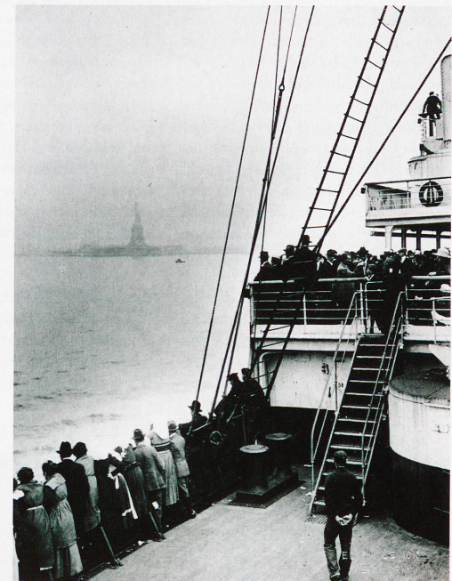
Auswanderer auf einem Schiff vor New York, aufgenommen 1915 von Edwin Levick