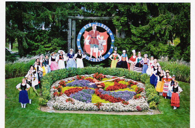
In New Glarus, gegründet 1845, werden viele Traditionen seit Generationen weitergeführt