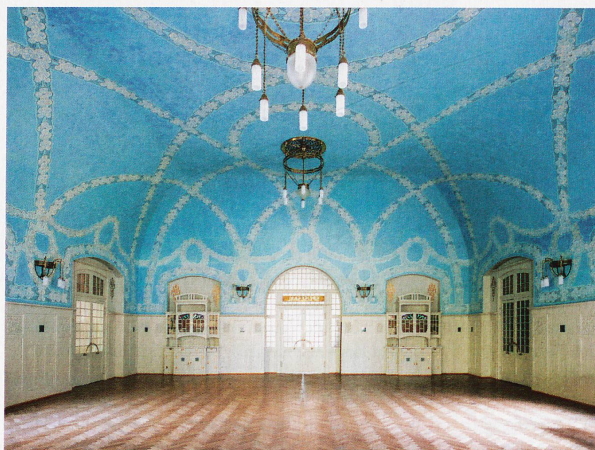
Speise- und Ballsaal des 1906 eröffneten Kurhauses Bergün, fotografiert 2009 von Ralph Feiner

Ausstellung: bis 12. Mai 2013 im Bündner Kunstmuseum Chur. www.buendner-kunstmuseum.ch Buch: «Ansichtssache», 150 Jahre Architektur- fotografie in Graubünden. Hrsg: Stephan Kunz und Köbi Gantenbein; Verlag Scheidegger & Spiess / Bündner Kunstmuseum, 384 Seiten; CHF 58.–, Euro 48.–