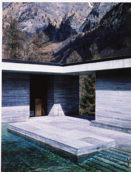
1996 eröffneter Neubau der Therme Vals von Architekt Peter Zumthor