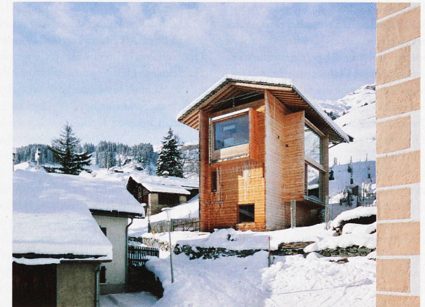
Vom Architekten Peter Zumthor erbautes Haus in Leis, fotografiert 2012 von Ralph Feiner

Ausstellung: bis 12. Mai 2013 im Bündner Kunstmuseum Chur. www.buendner-kunstmuseum.ch Buch: «Ansichtssache», 150 Jahre Architekturfotografie in Graubünden. Hrsg. Stephan Kunz und Köbi Gantenbein; Verlag Scheidegger & Spiess / Bündner Kunstmuseum, 384 Seiten; CHF 58.–, Euro 48.–