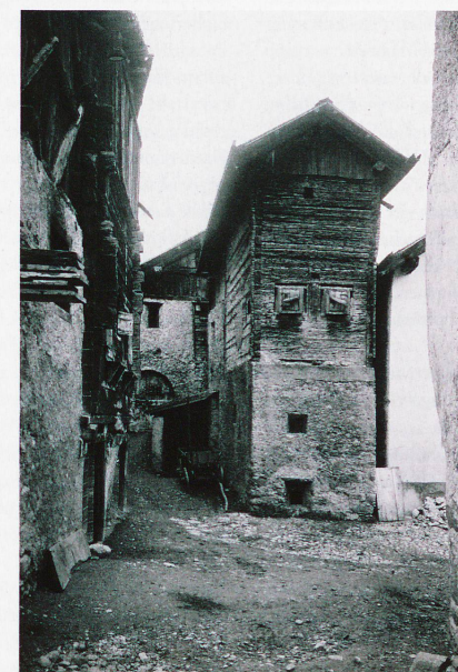
Wohnhaus in Zuoz