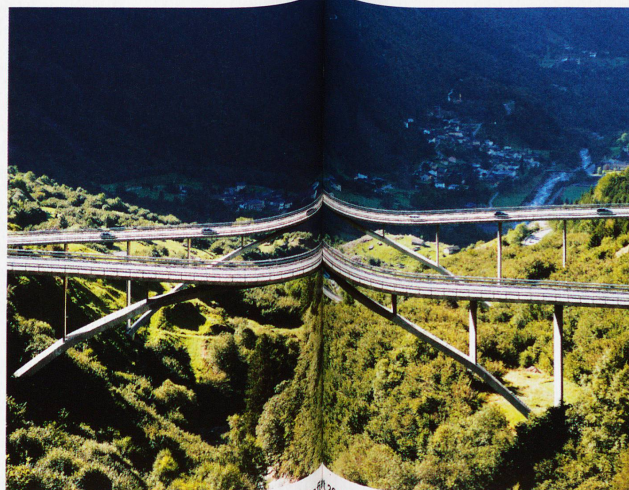
Ponte Nanin und Ponte Cascella in Mesocco, fotografiert 2009 von Ralph Feiner