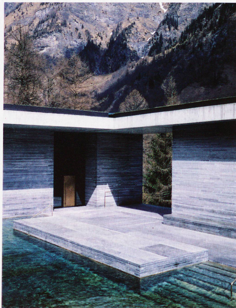
1996 eröffneter Neubau der Therme Vals von Architekt Peter Zumthor

immer wieder auch die Fotografen. Dem Blick der Fotografen auf die Architektur widmet das Kunstmuseum Chur nun eine Ausstellung. Dazu erschienen ist ein Lese-Bilder-Buch