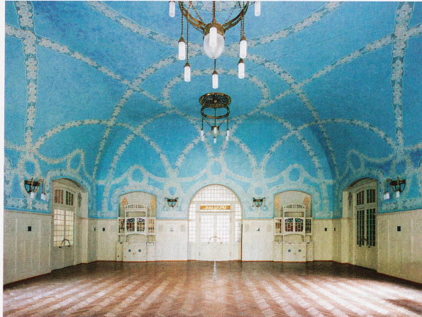
Speise- und Ballsaal des 1906 eröffneten Kurhauses Bergün

Baukunst und Architektur sind in Graubünden seit jeher geprägt von der Natur und der Landschaft – und vom Tourismus. Fasziniert hat die sehr eigenständige Architektursprache