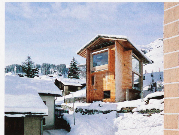
Vom Architekten Peter Zumthor erbautes Haus in Leis, fotografiert 2012 von Ralph Feiner