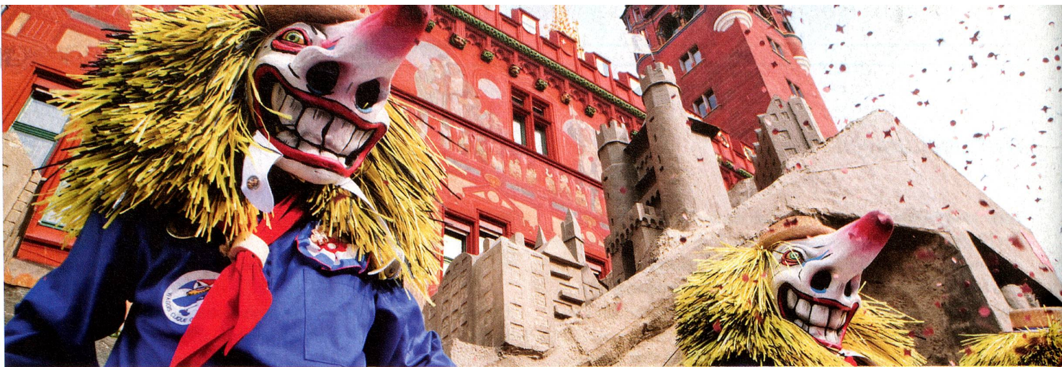
Fasnacht in Basel, Region Basel