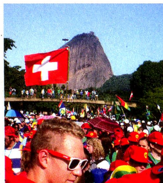
Participantes da JMJ

A Jornada Mundial da Juventude (JM) é um encontro que acontece a cada três anos, geralmente em uma grande cidade. O Papa convida os jovens do mundo inteiro para passar alguns dias junto a ele e refletirem sobre um tema.