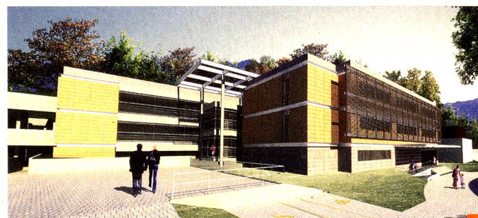
Novo prédio da ESB-RJ

A SIS - Swiss International School, esta construindo uma nova Escola, que abrigará, a partir do ano letivo de 2014, as turmas da Educação Infantil e os primeiros três anos do Ensino Fundamental I da Escola Suíço-Brasileira Rio de Janeiro.