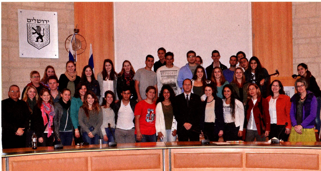
The youngster from the High Schools St. Michel and Beit Hinuch with Nir Barkat, Mayor of Jerusalem