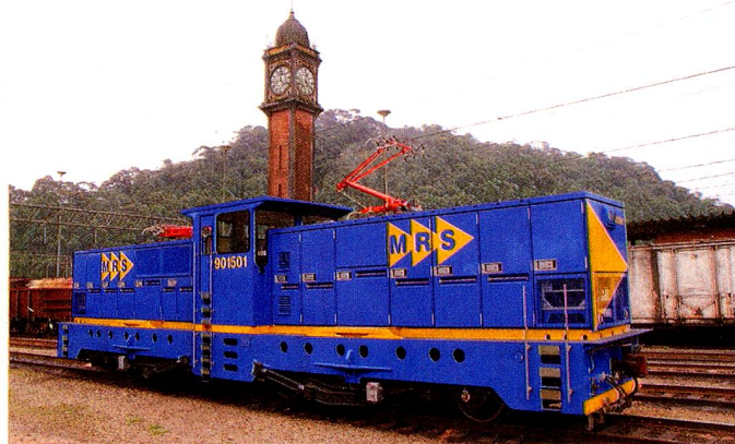
A nova locomotiva da Stadler que irá operar na Serra do Mar / SP

As locomotivas, fabricadas na Suíça, são chamadas de “cremalheiras” e possuem um sistema especial de engrenagens conectadas a um trilho dentado e motores, que freiam as composições na descida e alavancam na subida da serra.