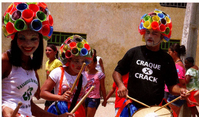
No Dia das Crianças 2012, jovens e colaboradores do GCASC organizaram um evento para as crianças da comunidade. O T-Shirt Craque x Crack refere a uma campanha do GCASC contra drogas.