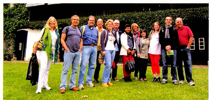
Em 16.11.2012 a equipe toda do Consulado Geral da Suíça no Rio de Janeiro visitou o ISCA.