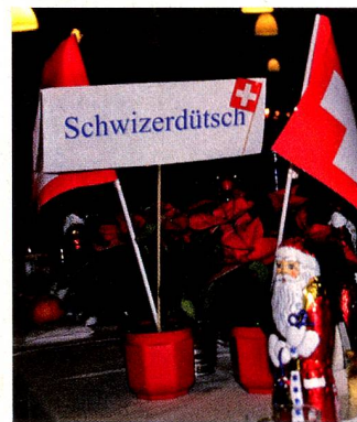
Dank der Schilder auf den Tischen fand jeder zu seiner Sprachgruppe.