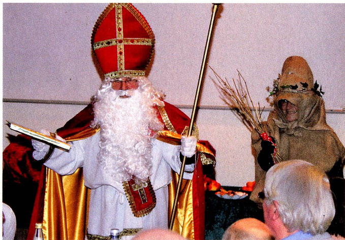
Samichlaus und Schmutzli bei der «Helvetia» Köln