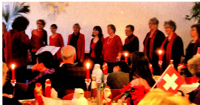
Die Wedding Pearls intonierten zum Auftakt den bekannten Beatles-Song für die Senioren aus dem Grossraum Berlin.

«In Berlin ist es als Schweizer eine Freude, endlich die 65er-Marke überschritten zu haben, denn dann wird man von der Schweizerischen Wohltätigkeitsgesellschaft Berlin eingeladen», bemerkte schmunzelnd ein rüstiger Rentner bei der Weihnachtsfeier.