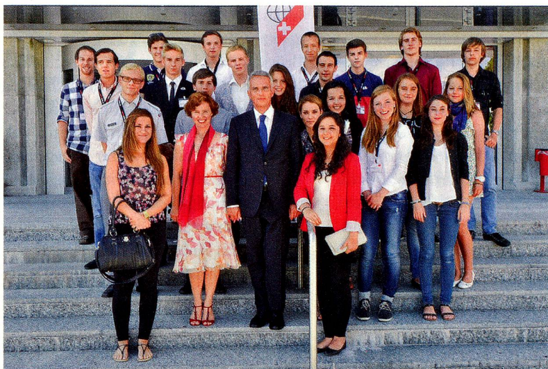
Oben: Junge Auslandschweizer mit Bundesrat Didier Burkhalter und seiner Frau Friedrun beim Auslandschweizer-Kongress in Lausanne Unten: Die Adventure-Crew des letztjährigen Lagers