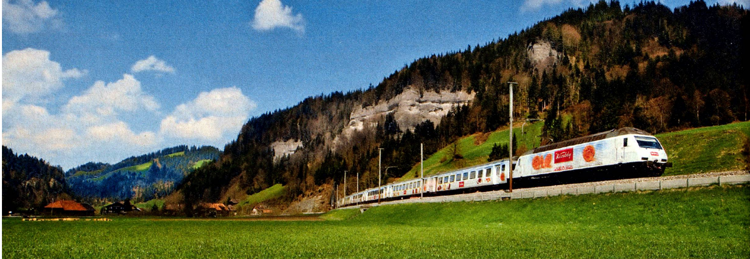
BLS RegioExpress im Emmental, Region Bern