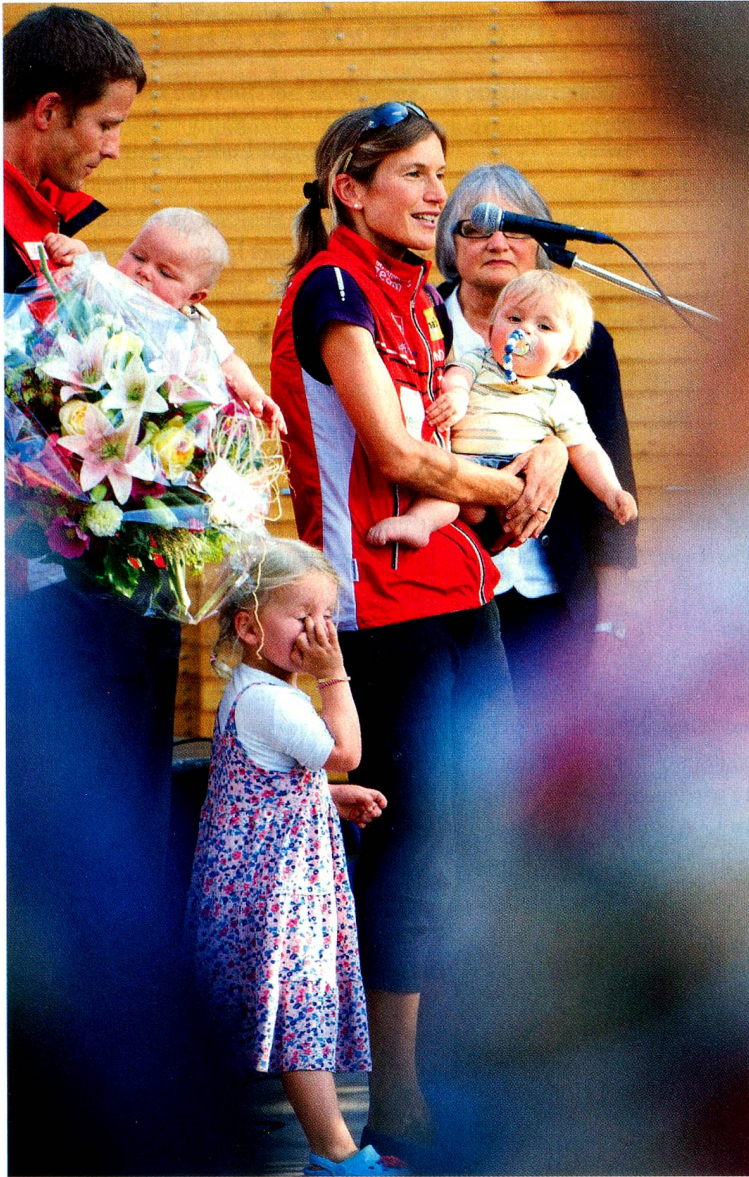
Mit Ehemann und Kindern beim Empfang in Münsingen nach der WM

sie gelassener und ausgeglichener sind, wenn sie hin und wieder etwas für sich selber machen. Das dient ja auch dem Kind.»