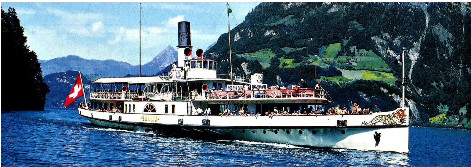
Wilhelm Tell Express auf dem Vierwaldstättersee, Zentralschweiz