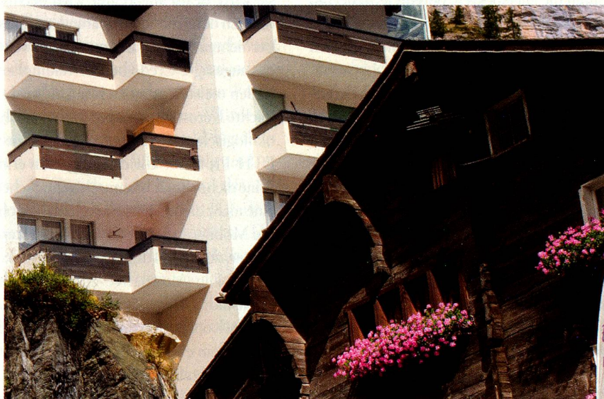
Davos und Zermatt: Die Bilder machen klar, warum die Zweitwohnungsinitiative angenommen wurde