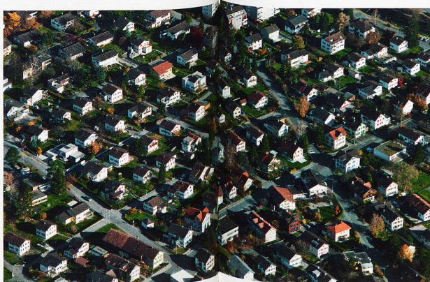
In der Nähe von Buchs in Kanton St. Gallen: Ein Einfamilienhaus reiht sich ans andere

Umweltfreundliche Urbanität mausert sich zum neuen Massstab. Im Gegenzug wird der bisher fest verankerte Schutz des Waldes zunehmend in Frage gestellt, obwohl ausgerechnet beim Waldschutz die Raumplanung des Bundes bisher am wirkungsvollsten war. Mit dem Grundprinzip, dass nur Wald roden darf, wer anderswo Wald aufforstet, konnte die Waldfläche in den letzten Jahrzehnten auch im Mittelland erhalten werden.