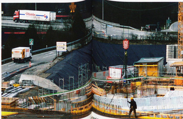
Grossbaustelle in Bern-Brünnen: Es entsteht ein Einkaufszentrum mit elf Kinosälen, zehn Restaurants, Hotel und Erlebnisbad

Doch jetzt wächst der Druck auf stadtnahe Wälder. Gegenwärtig führt Bern eine aufgeladene Debatte darüber, ob nicht Teile des Bremgartenwaldes zugunsten einer stadtnahen Siedlung für 8000 Menschen abgeholzt werden sollten. Das Hauptargument lautet, abgeholzter stadtnaher Wald führe zu weniger Zersiedelung als die Einzonung grüner Wiesen an der Peripherie des Stadtgebietes.