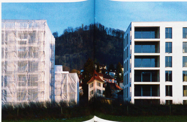
Köniz im Schweizer Mittelland: Trotz Wakker-Preis für «ideale Siedlungsentwicklung» nicht immer ein harmonischer Anblick