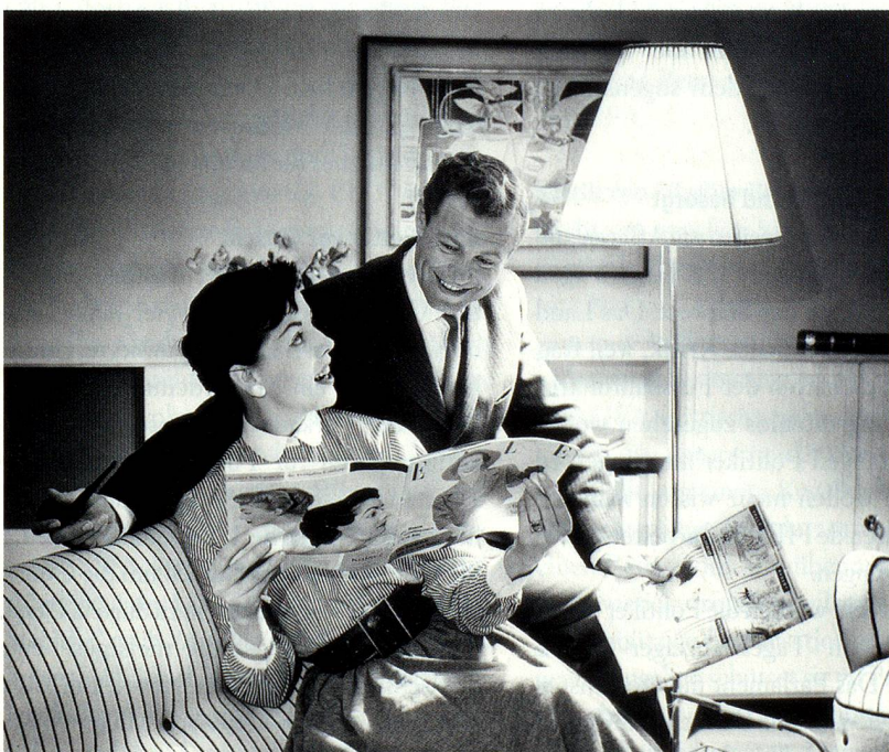
Fröhliches Musterehepaar um 1958, Bild von Max Roth (ohne Titel)