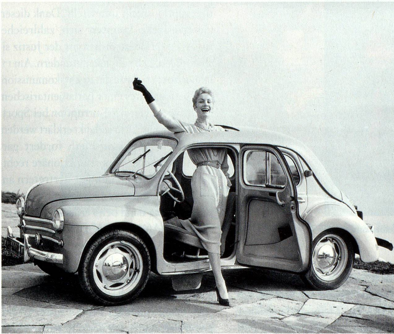
Bilder im Uhrzeigersinn: Renault-Heck-4CV, Werbung um 1964, Bild von Max Roth

«Schöner leben, mehr haben», Limmat Verlag, Zürich; Herausgeber Thomas Buomberger und Peter Pfunder; 267 Seiten; ISBN: 978-3-85791-649-6; Preis: ca. CHF 48.–