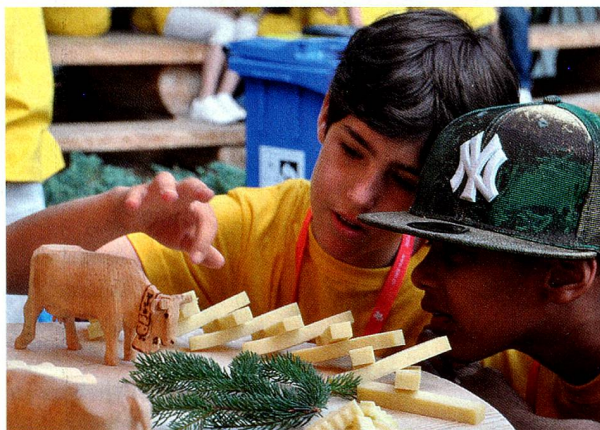
Fröhliches Treiben während eines früheren Sommerlagers der Stiftung für junge Auslandschweizer

Möglichkeit, den Lagerbeitrag zu reduzieren. Das Antragsformular kann zusammen mit der Anmeldung angefordert werden.