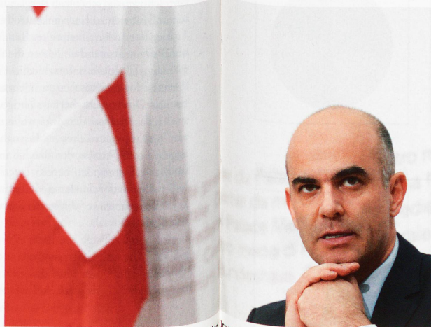
Alain Berset bei seinem ersten Auftritt vor den Medien kurz nach seiner Wahl zum Bundesrat

Nach ihrer problemlosen Wiederwahl hat das Parlament Eveline Widmer-Schlumpf auch noch mit einem Glanzresultat zur Bundespräsidentin für das laufende Jahr gekürt. Vizepräsident ist Ueli Maurer. Neuer Vorsteher des Departements für Auswärtige Angelegenheiten (EDA) wird Bundesrat Didier Burkhalter. Der Freisinnige aus Neuenburg leitete seit seiner Wahl in den Bundesrat 2009 das Departement für Inneres (EDI). Dieses übernimmt nun Alain Berset. Die anderen fünf Bundesräte führen die gleichen Departemente wie vor den Wahlen.